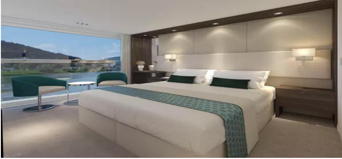
Panoramik Pencere Dış Kabin - Alt Kat (16 m 2 )