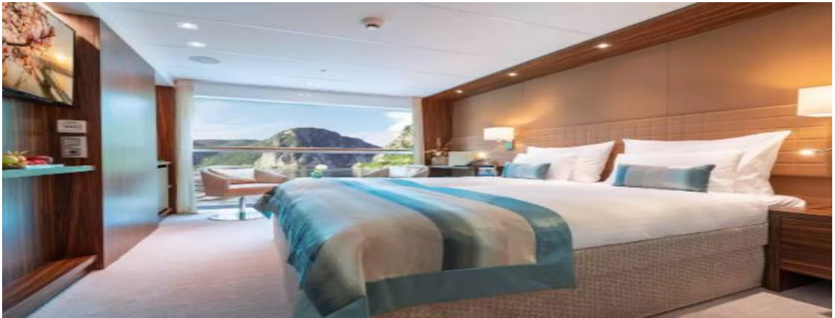
Panoramik Pencere Dış Kabin - Alt Kat (16 m 2 )