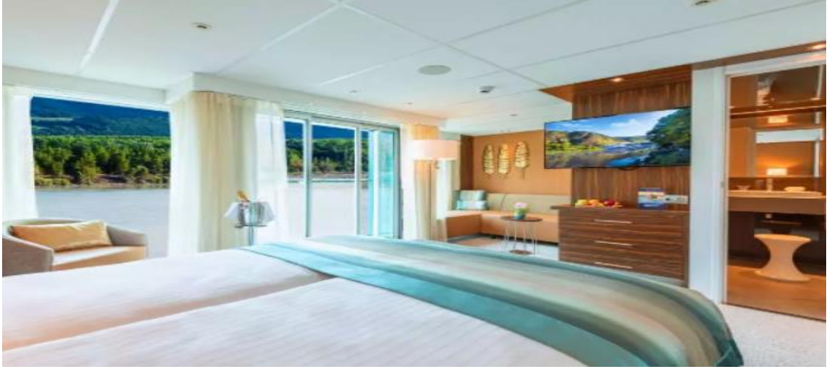
French Balkonlu Kabin - Orta ve Üst Kat (18 m 2 )