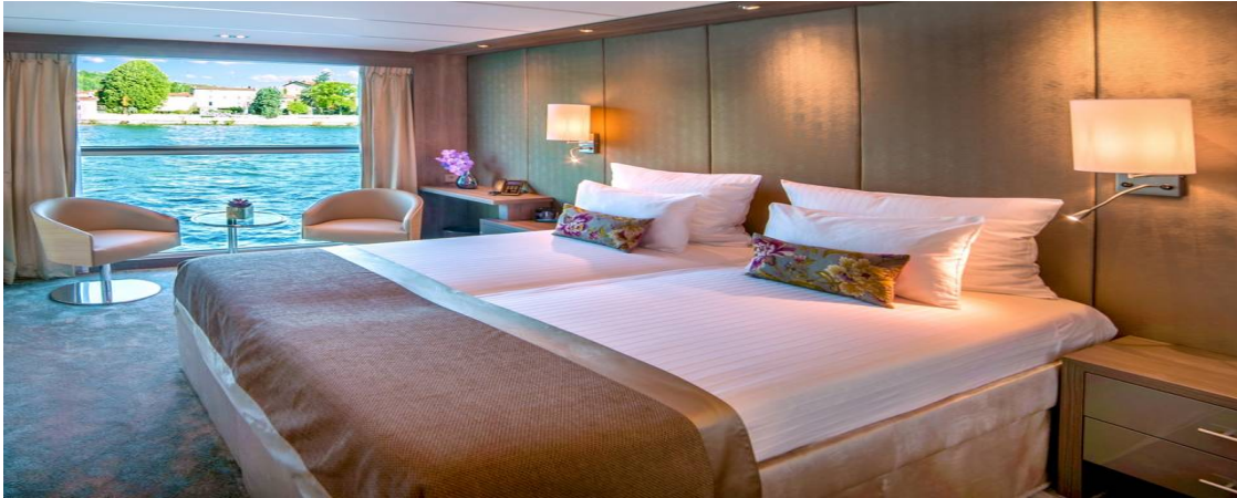
Panoramik Pencere Dış Kabin - Alt Kat (16 m 2 )