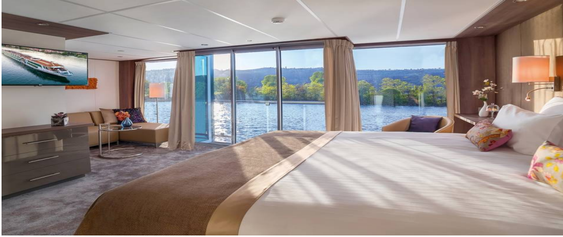
French Balkonlu Kabin - Orta ve Üst Kat (18 m 2 )